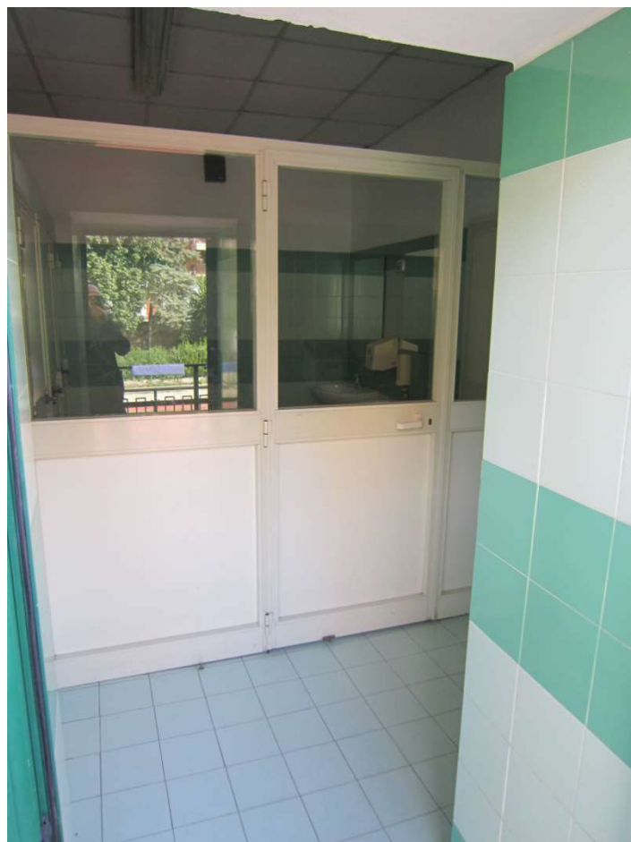
Ingresso spogliatoi - 013