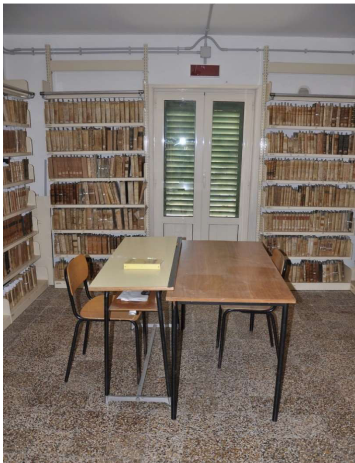
Sala - 009