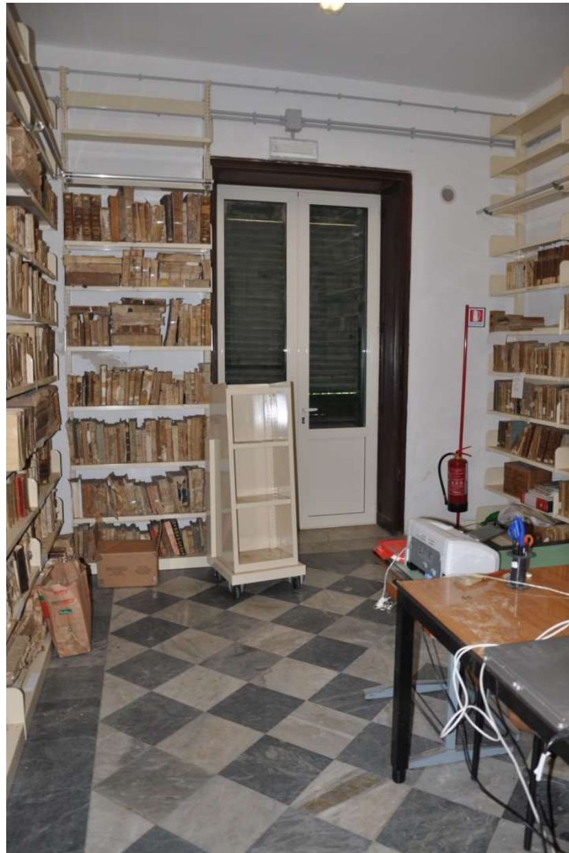
Sala - 015