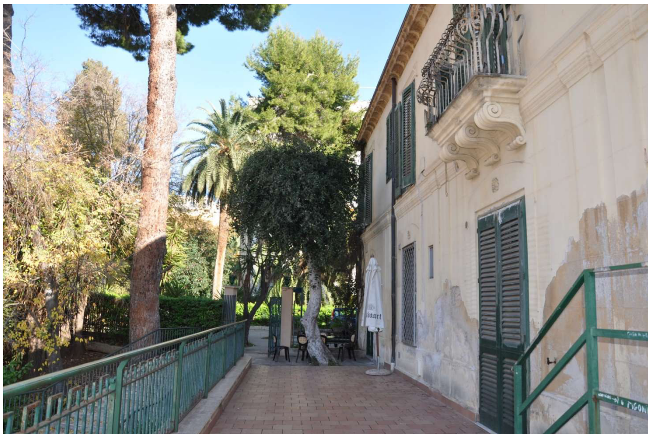
Dettaglio prospetto laterale dx