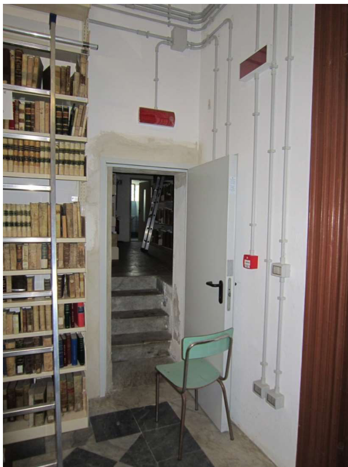
Ingresso ala rialzata 005-010