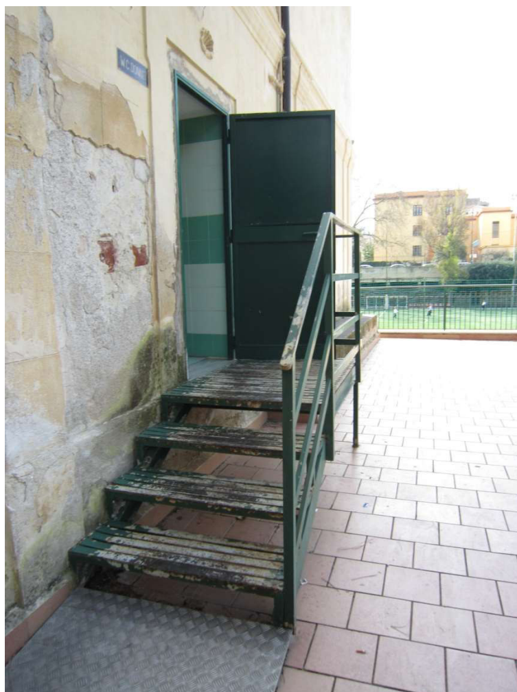
Dettaglio scala per spogliatoi