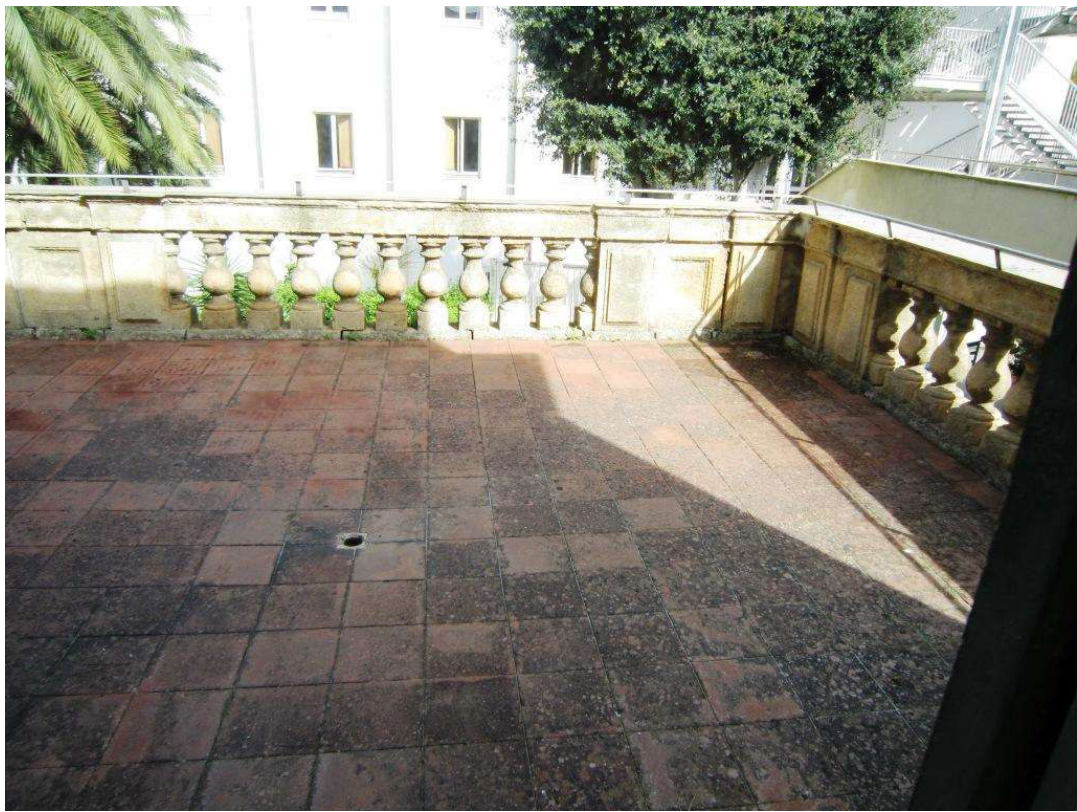
Terrazzo su prospetto