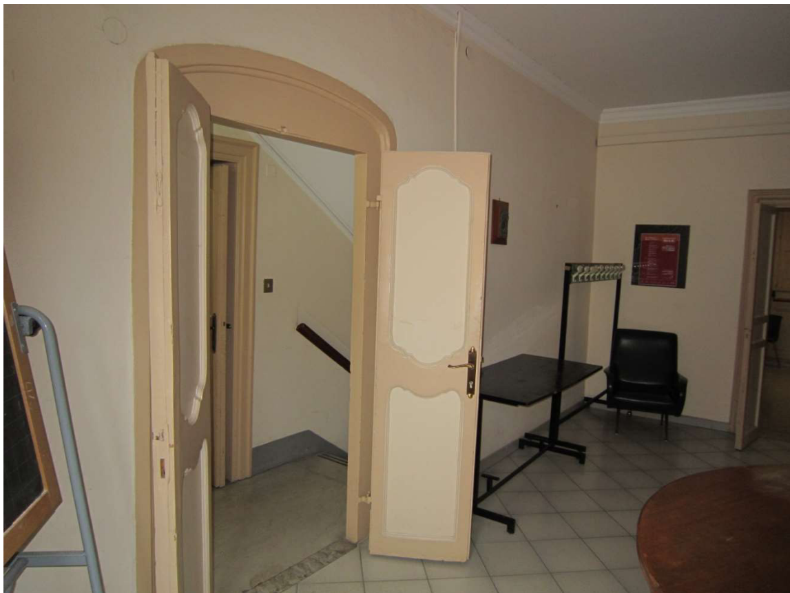
Hall ingresso - 102