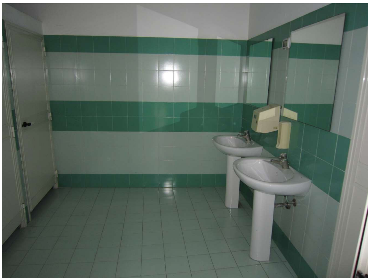
Bagni interni - 013