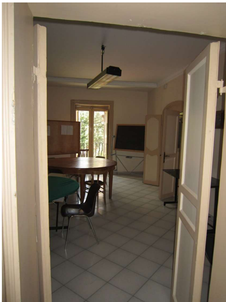
Sala - 107