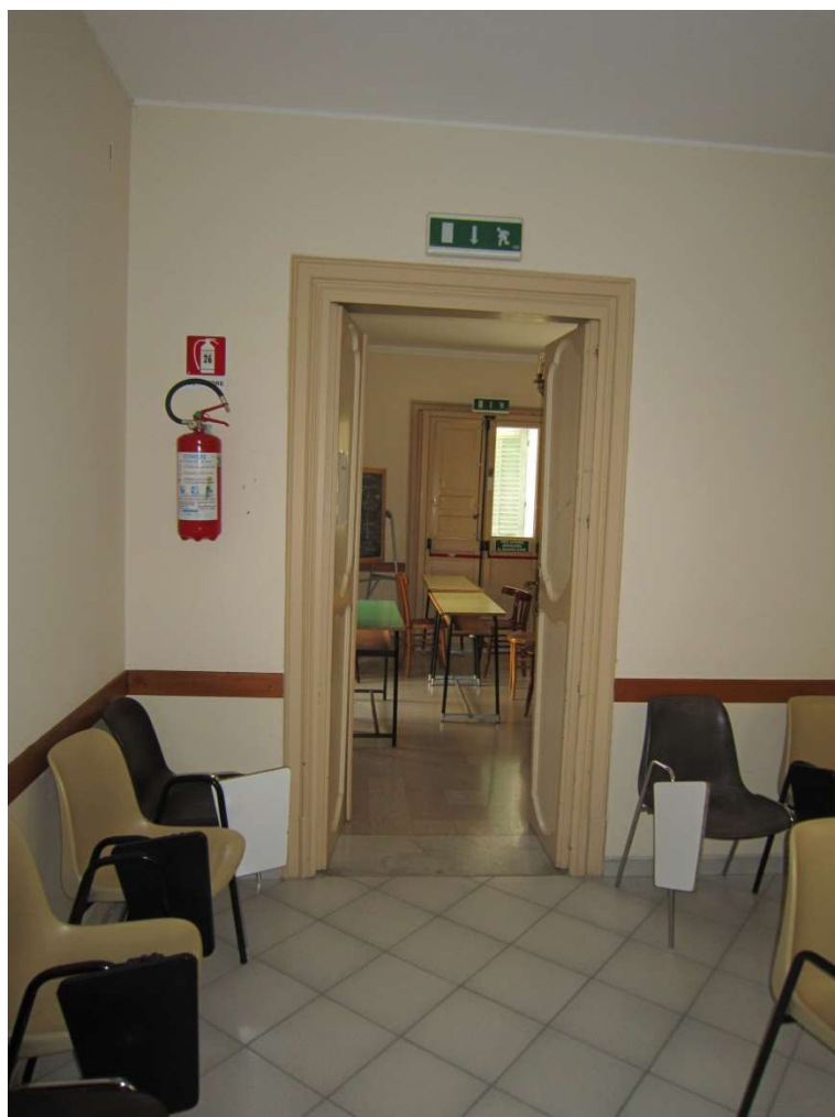
Dettaglio sala 111-110