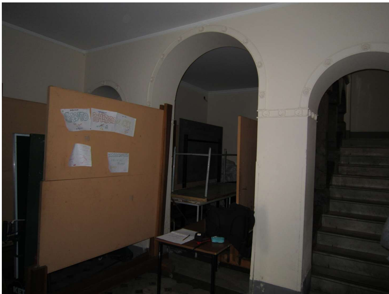
Dettaglio Hall Ingresso