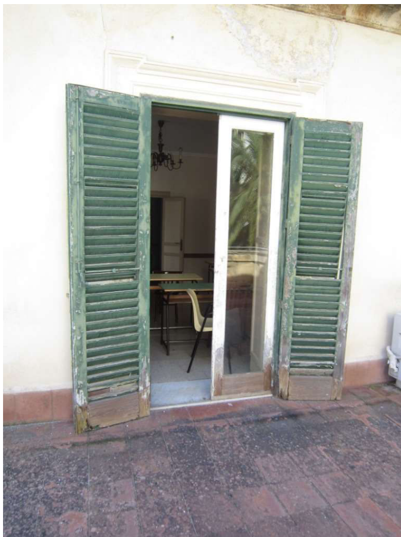
Particolare infissi esterni