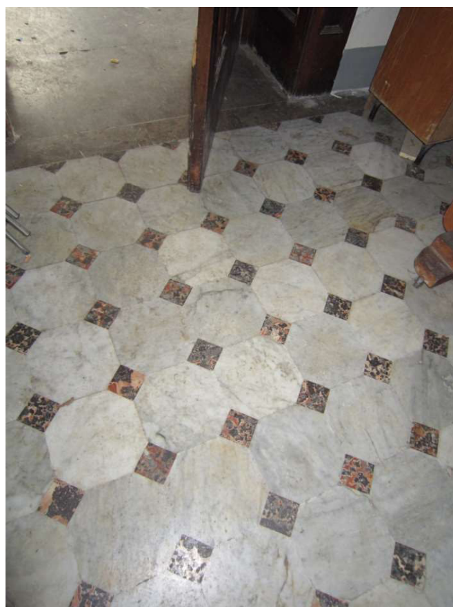
Pavimentazione Hall Ingresso