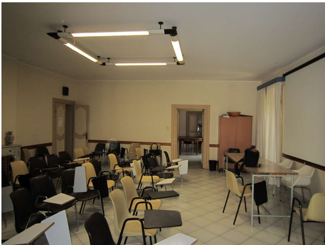
Sala - 111