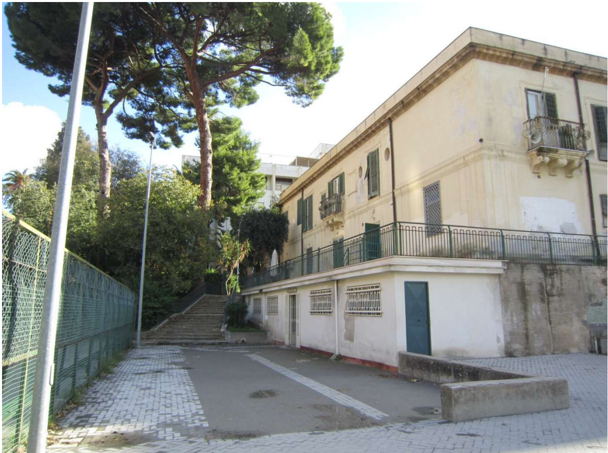
Vista laterale dx e posteriore dalla quota dei campi sportivi