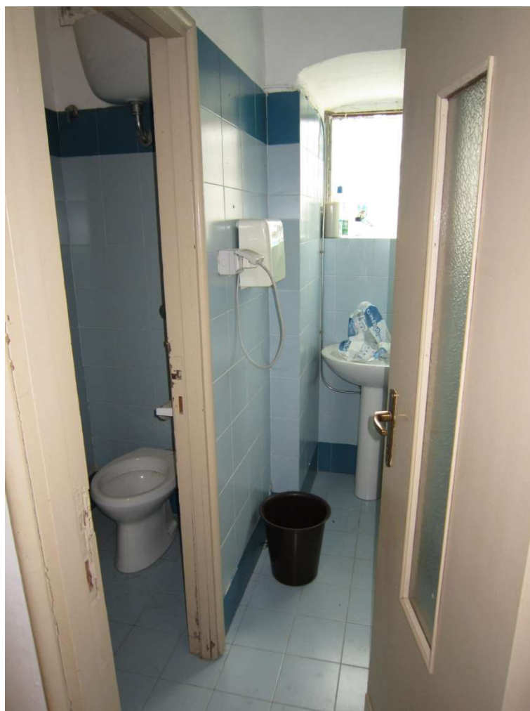
Dettaglio bagni - 011