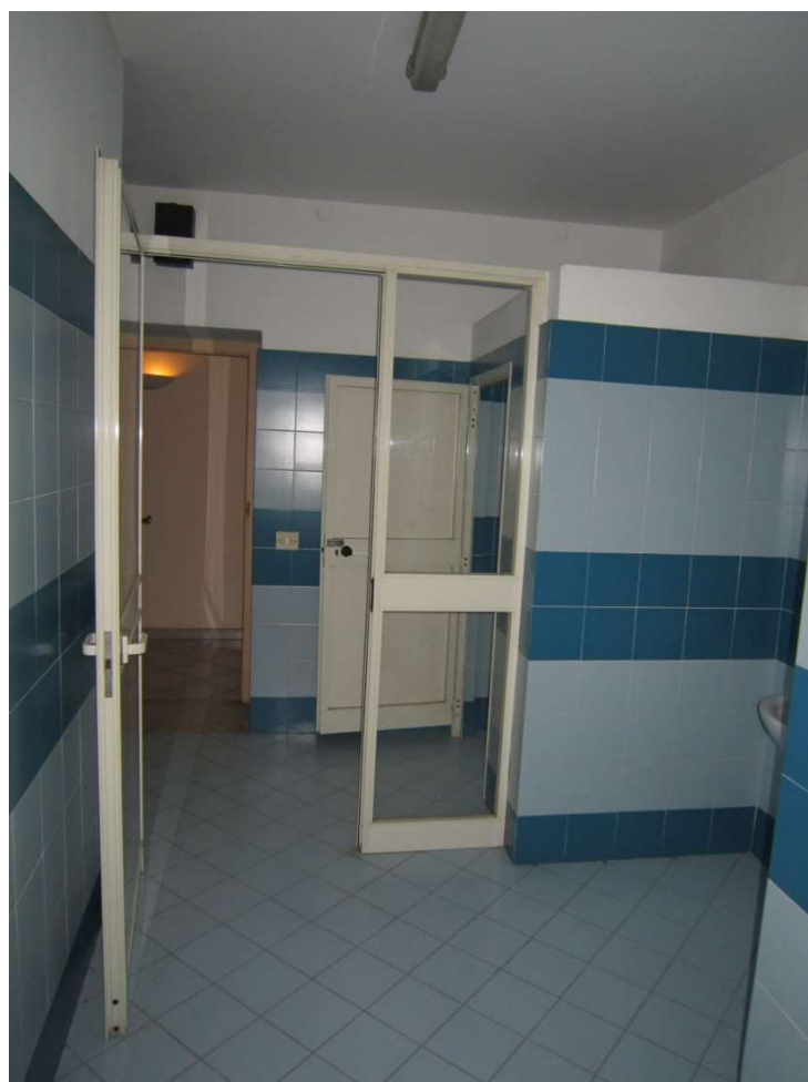
Bagni - 104