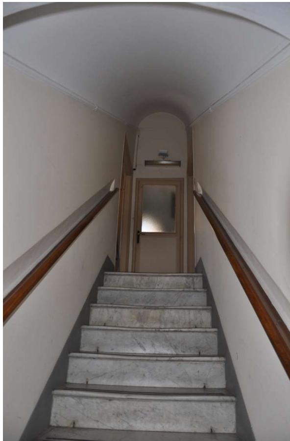
Scala per il piano primo