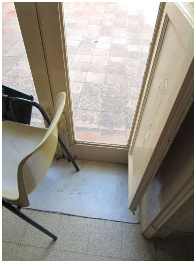
Dettaglio pavimenti e porta finestra sala - 110