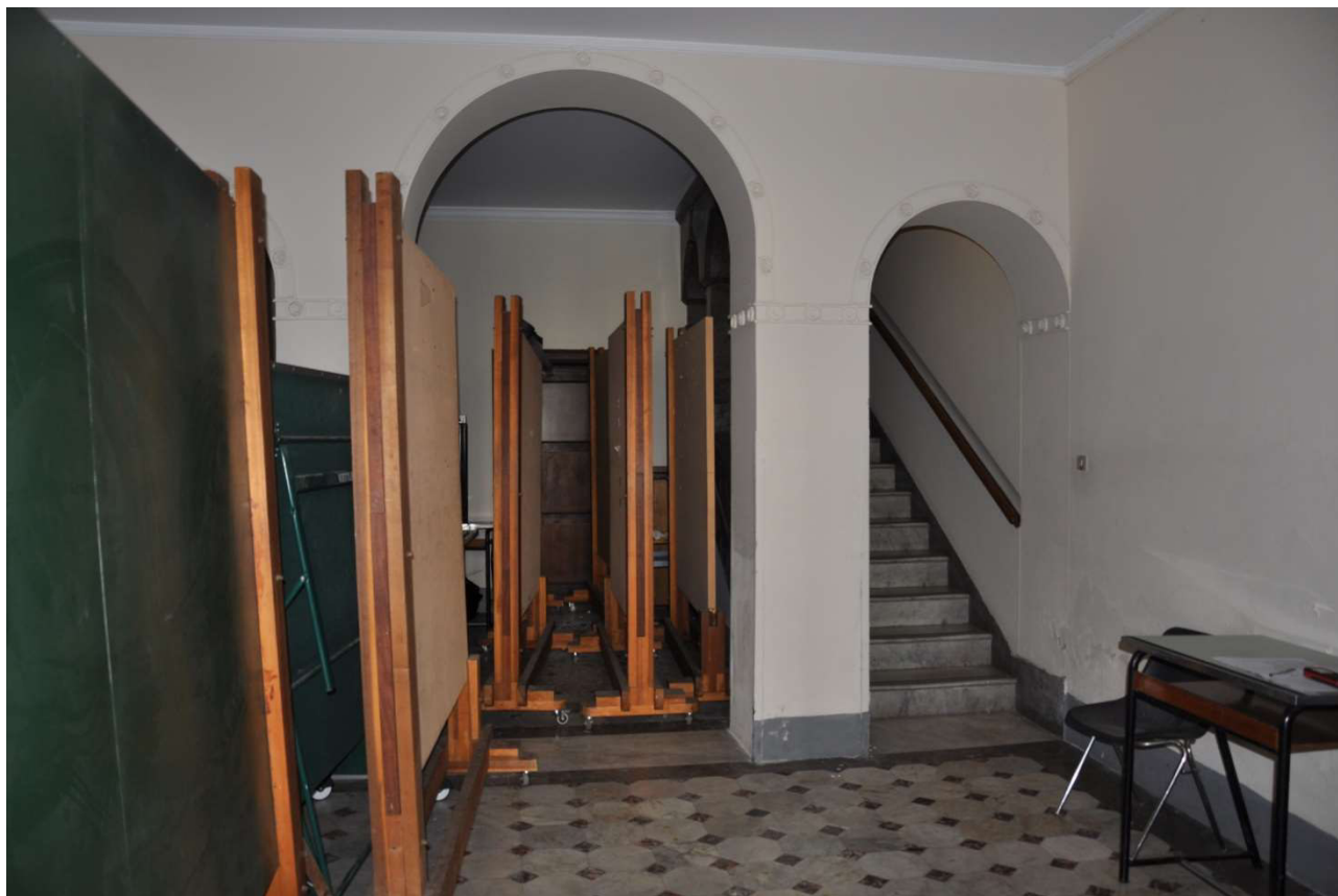
Ingresso Casina – Hall Ingresso 002-003