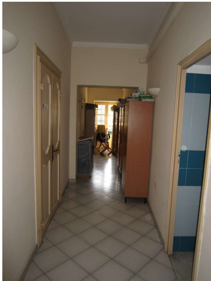
Corridoio - 103