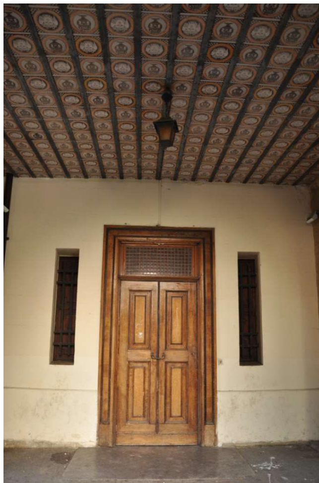
Particolare del portone di ingresso