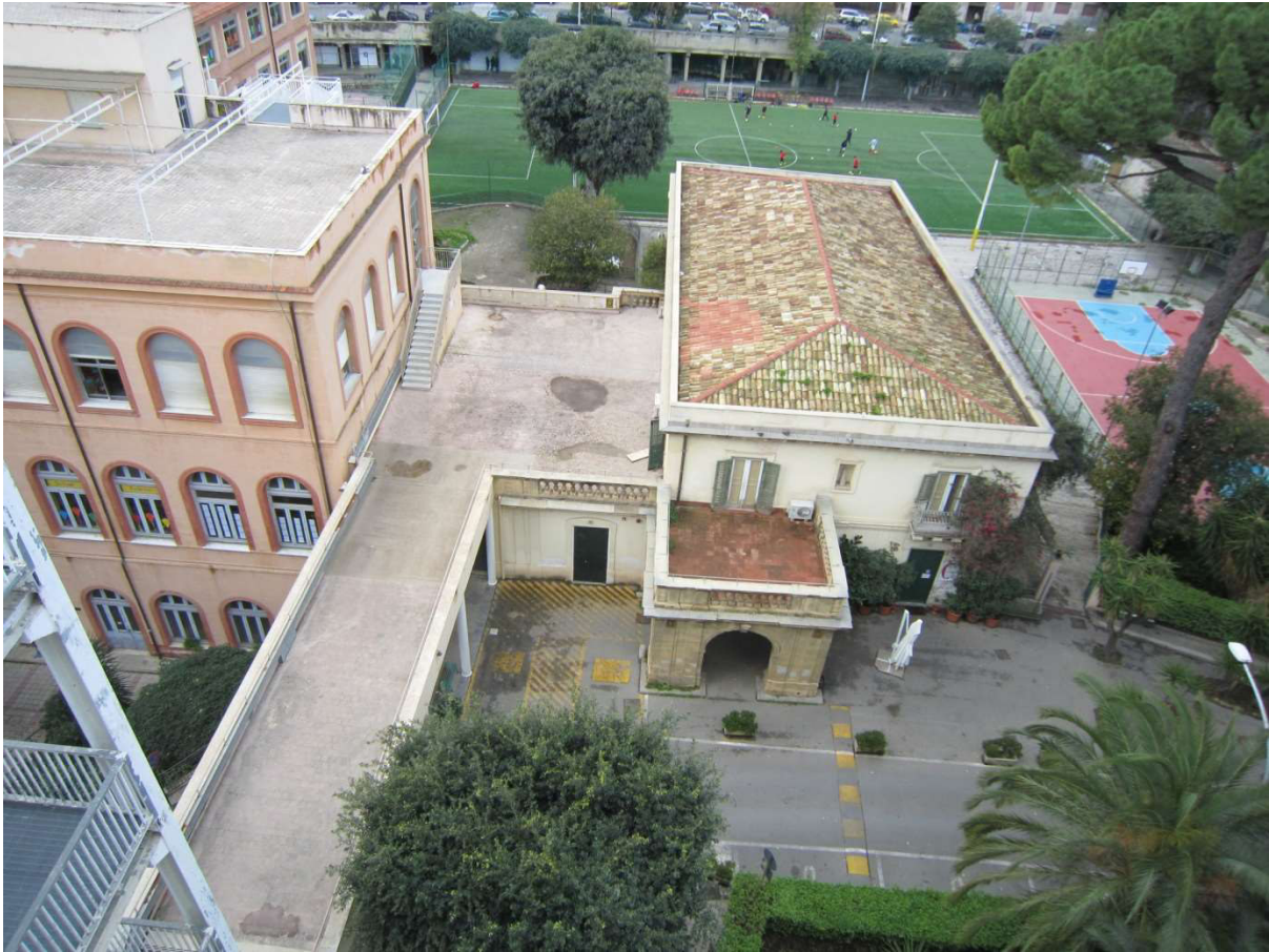
Vista complessiva prospetto principale