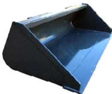
b - benna Standard