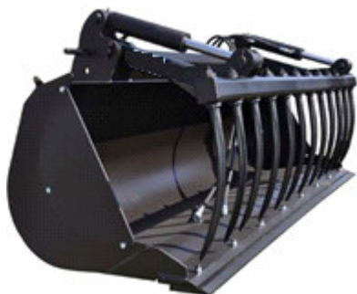
a - benna a polipo (a pinza)